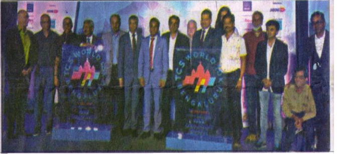
ವಿಶ್ವ 10ಕೆಗೆ ಬೆಂಗಳೂರು ನಗರ ಮತ್ತೊಮ್ಮೆ ಆತಿಥ್ಯ ವಹಿಸುತ್ತಿದೆ. ಈ ಸಂದರ್ಭದಲ್ಲಿ ಟಿಸಿಎಸ್ ವಿಶ್ವ 10ಕೆ ವಿಭಾಗದಲ್ಲಿ ಎಲ್ಲಾ ಮಹಿಳಾ ಸಮುದಾಯದ ಪೇಸರ್‌ಗಳಿಗೆ ಪಾಲ್ಗೊಳ್ಳುವುದನ್ನು ಪ್ರೋತ್ಸಹಿಸುತ್ತಿದೆ.

ದಿನಾಂಕವನ್ನು ಬದಲಾಯಿಸಲಾಗುತ್ತದೆ. ಈ ಕುರಿತು ಪ್ರೋಕ್ಯಾಮ್ ಇಂಟರ್‌ನ್ಯಾಷನಲ್ ನಿರಂತರವಾಗಿ ಎಲ್ಲಾ ರೀತಿಯ ಅಪ್‌ಡೇಟ್ ನೀಡಲಿದೆ.