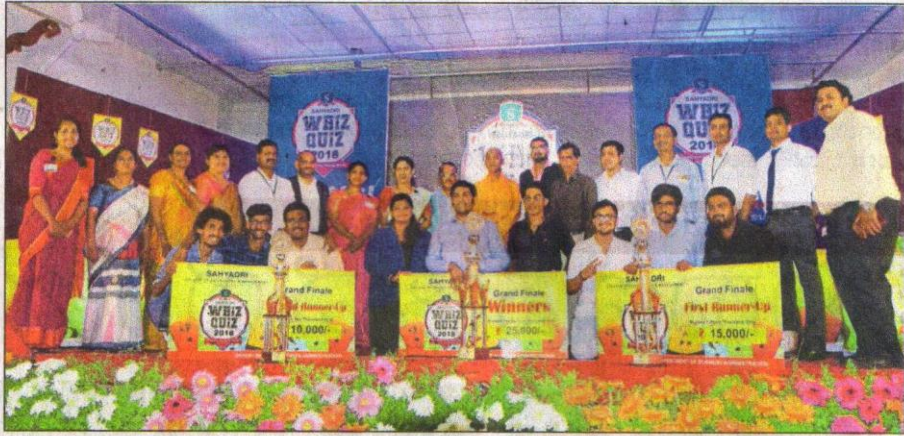
ಮಂಗಳೂರಿನ ಸಹ್ಯಾದ್ರಿ ಎಂಜಿನಿಯರಿಂಗ್ ಕಾಲೇಜಿನಲ್ಲಿ ಶುಕ್ರವಾರ ನಡೆದ ಸಹ್ಯಾದ್ರಿ ವಿಡ್ಯು ರಸಪ್ರಶ್ನೆ ಸ್ಪರ್ಧೆಯ ವಿಜೇತ ತಂಡಗಳಿಗೆ ಬಹುಮಾನ ವಿತರಿಸಲಾಯಿತು.